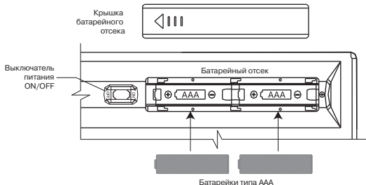
Рис. 1. Вид снизу